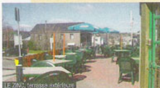
LE ZINC, terrasse extérieure

Quand le Bourbon a ouvert ses portes en 1980, 30 personnes tout juste y prenaient place. Depuis, chaque lundi, on compte entre 5000 et 6000 fêtards. Cet été, l'équipe fait place à une nouvelle terrasse qui donnera une belle vue sur le terrain où sont présentés plusieurs spectacles extérieurs.