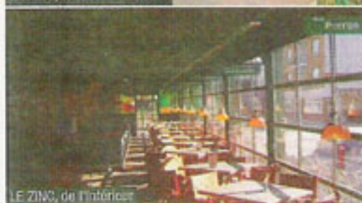
LE ZINC, de l'intérieur