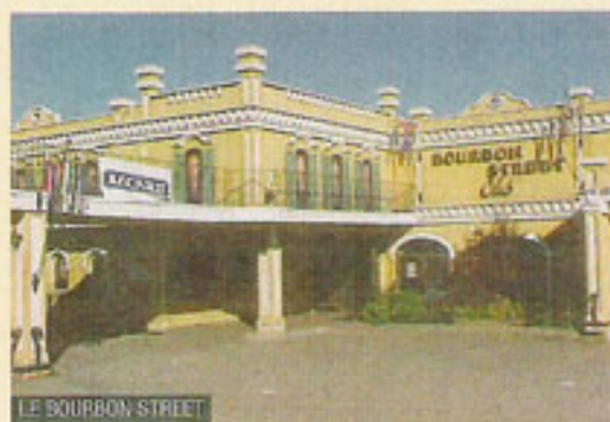
LE BOURBON STREET

Institution reconnue à Jonquière depuis plus de 15 ans. Terrasse urbaine et très tendance, digne de celles des grandes villes. Lorsque les portes de garage sont ouvertes, la terrasse devient encore plus imposante. Vous pouvez arriver tôt et rester là jusqu'à 3 heures du matin. La musique est bonne, la bouffe est respectable et les clients ont le cœur à la fête.